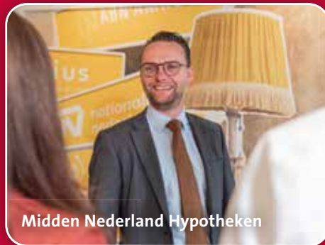
Midden Nederland Hypotheken