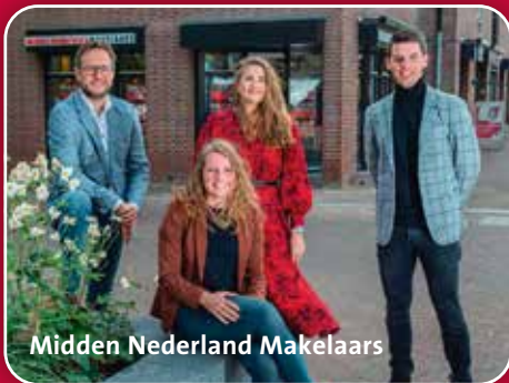
Midden Nederland Makelaars